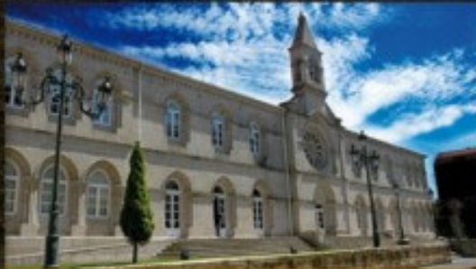
Edificio Área Panorámica