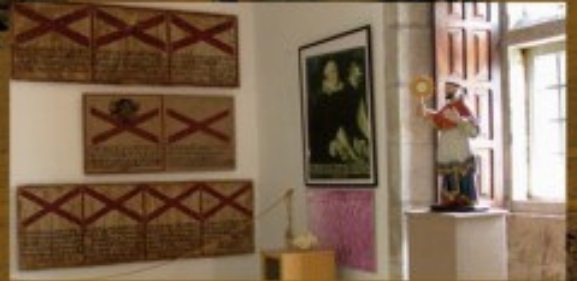
Sambenitos, Museo Diocesano