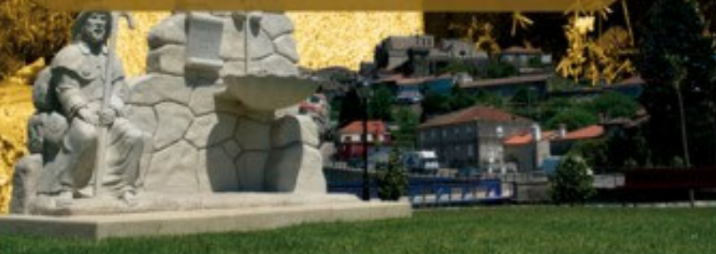
Monumento al peregrino