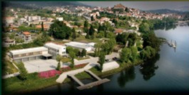
Vista aérea Centro Piragüismo - Remo