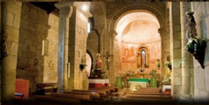
Iglesia de San Bartolomé

Levantada sobre precedentes romanos y suevos esta iglesia data del siglo XI, con su planta basilical, destacando sus capiteles historiados de rudo primitivismo. En la capilla mayor se conservan unas magnificas pinturas murales del siglo XVI. Este antiguo monasterio fue sede episcopal en los primeros tiempos medievales.