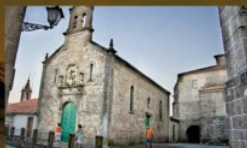
Capilla de la Misericordia

Su fachada es obra del artista tudense Melchor Alonso Feal y data de 1575, siendo un ejemplo del arte del Renacimiento; en su interior se conservan algunas de las imágenes procesionales de la Semana Santa, destacando la Dolorosa, obra del escultor Agustín Querol.