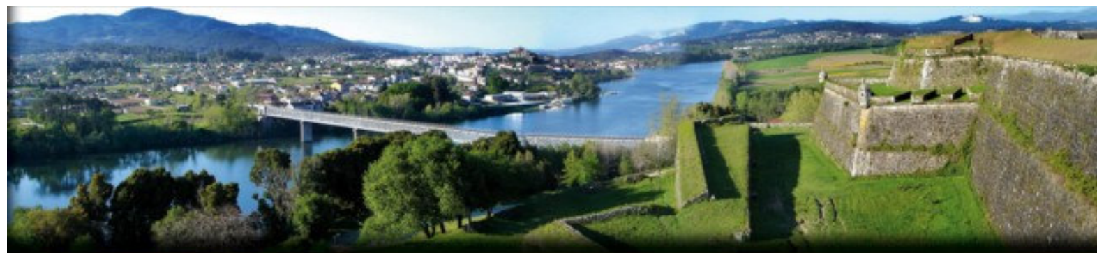
Vista de Tui desde Valença

Excmo. Concello de Tui Praza do Concello, 1 - 36.700 - Tui 986 603 625 - 696 482 248 www.concellotui.org