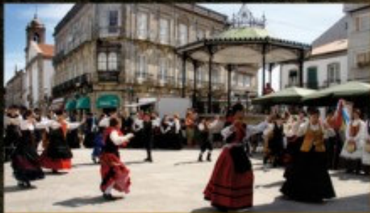
Paseo de la Corredoira

El concello de Tui cuenta con unas excepcionales condiciones geográficas y climáticas, idóneas comunicaciones (existe conexión por autovía y autopista con Galicia y el resto de España y con Portugal), y un atractivo conjunto histórico.