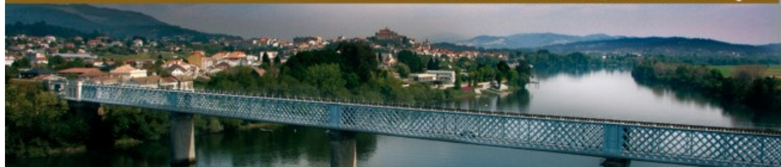
Puente Internacional, visto desde Portugal

Cabe visitar el Museo Diocesano y el Catedralicio, los centros de interpretación del Monte Aloia o del Camino Portugués. Los atractivos del conjunto histórico, con la Catedral de Santa María como referente, y los recursos naturales del Parque Natural del Monte Aloia y el Río Miño, justifican una visita a esta ciudad de Tui.