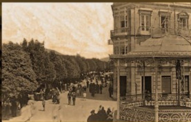
Paseo de la Corredoira, inicios S. XX