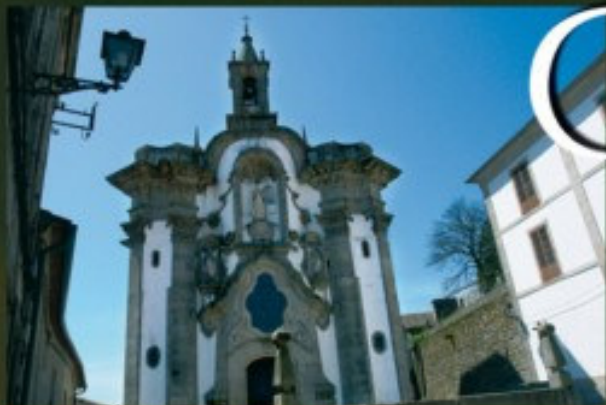
Capilla de San Telmo