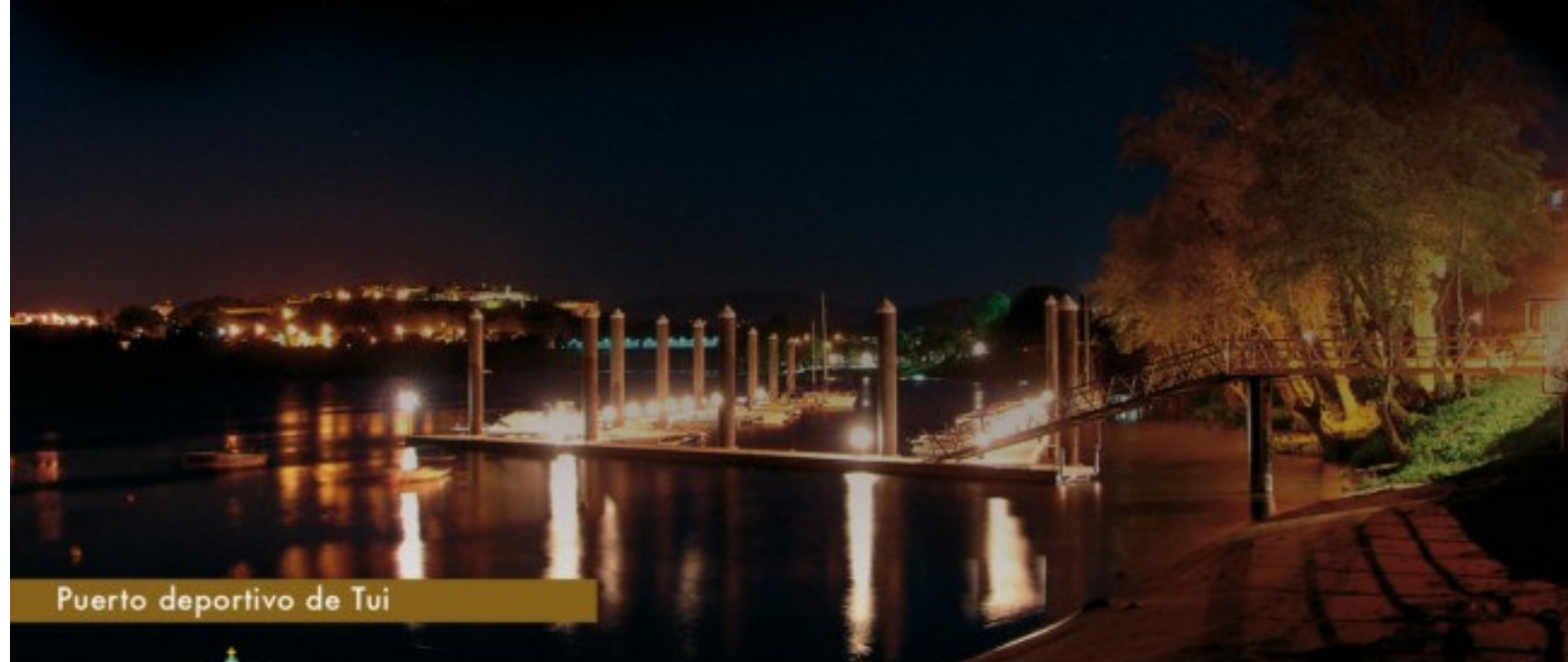
Puerto deportivo de Tui

Excmo. Concello de Tui Praza do Concello, 1 - 36.700 - Tui 986 603 625 - 696 482 248 www.concellotui.org