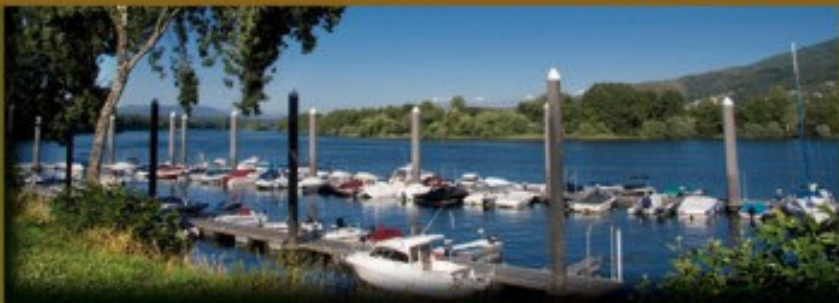
Puerto deportivo de Tui