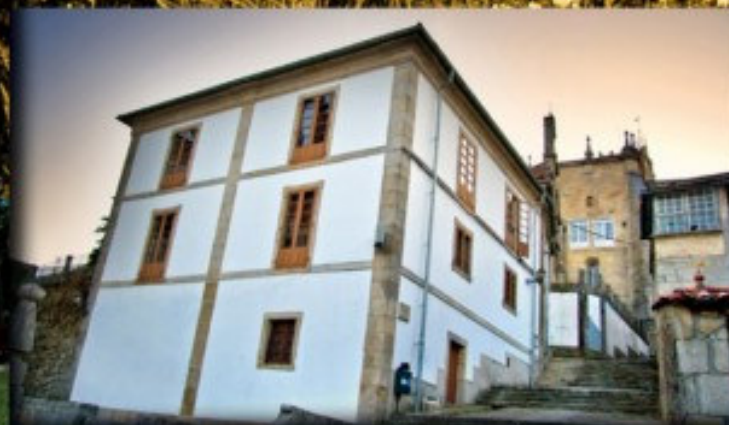
Albergue de peregrinos