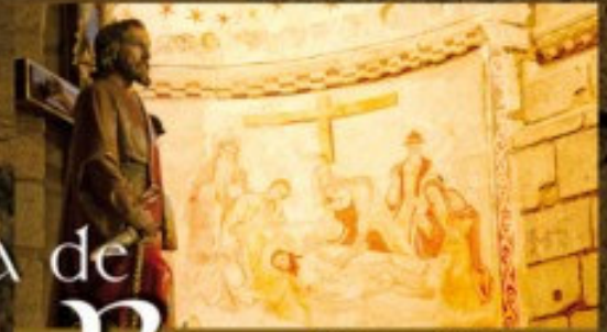
Pinturas S. XVI