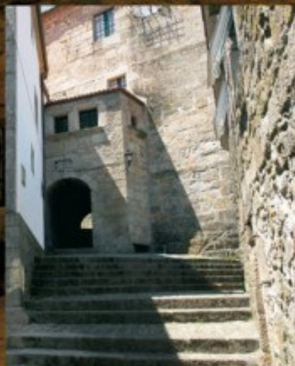
Túnel de las Encerradas

Sobre los antiguos palacios episcopales de la Oliveira se edifica entre los siglos XVII y XVIII el actual convento. La Iglesia, de finales del XVII, está diseñada por el arquitecto Domingo de Andrade, autor de la fachada del Obradoiro compostelano. Las monjas clarisas, "Encerradas", elaboran unos deliciosos pececitos de almendra.