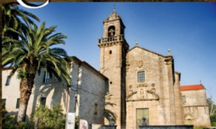
Iglesia de Santo Domingo