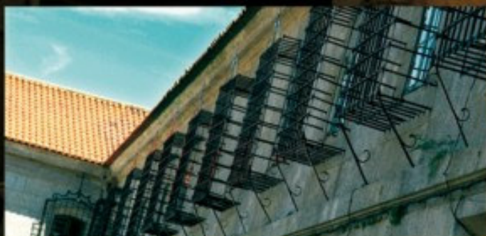
Convento de las Encerradas

Sobre los antiguos palacios episcopales de la Oliveira se edifica entre los siglos XVII y XVIII el actual convento. La Iglesia, de finales del XVII, está diseñada por el arquitecto Domingo de Andrade, autor de la fachada del Obradoiro compostelano. Las monjas clarisas, "Encerradas", elaboran unos deliciosos pececitos de almendra.