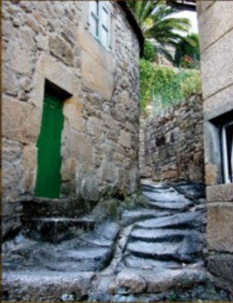
Calle de la Soidade

Tui contó, a lo largo de la historia, con una dinámica población judía que disponía de sinagoga, cementerio, etc. Aquí está documentada la única carnicería judía de Galicia. Tras su expulsión, en 1492, se mantuvo la presencia de conversos y judaizantes como lo testimonian los "sambenitos" únicos en España conservados en el Museo Diocesano y la figura singular de médico y filósofo del siglo XVI, Francisco Sánchez "El escéptico".