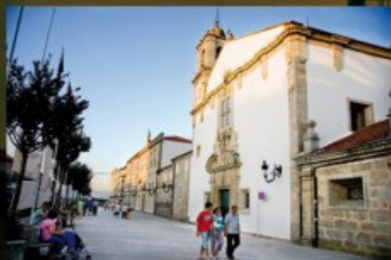
Iglesia de San Francisco