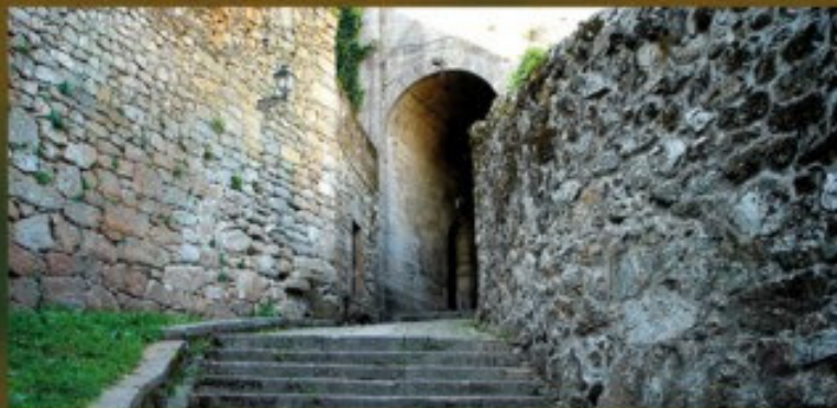
Túnel de la Misericordia

Conserva la ciudad restos de los dos recintos amurallados levantados para su defensa. Uno de época medieval (siglos XII y XIII) formaba un amplio trapecio irregular, con varias torres defensivas. Solo se conserva "A Porta da Pia", con sus postigos visibles, la base de la torre y diversos lienzos. En los siglos XVII y XVIII, con ocasión de las guerras con Portugal, se edifica un nuevo sistema amurallado, más amplio, cuyos principales vestigios, se observan, por ejemplo, en el Paseo Fluvial.