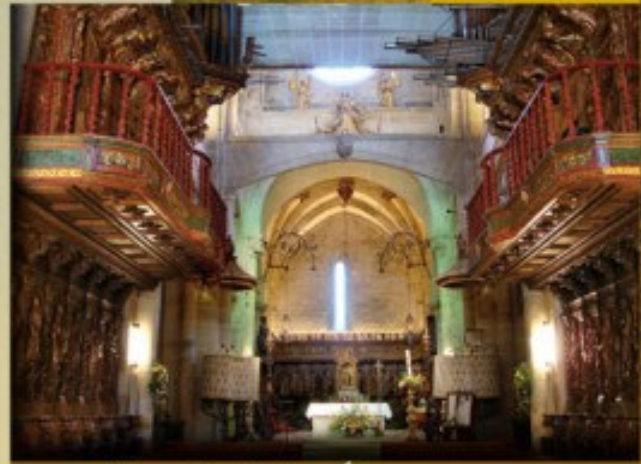
Nave Central y Órganos

El claustro es el único gótico conservado en las catedrales gallegas. Destacar el paisaje que se contempla desde el torreón de los Soutomaior y la primitiva Sala Capitular románica del siglo XII.