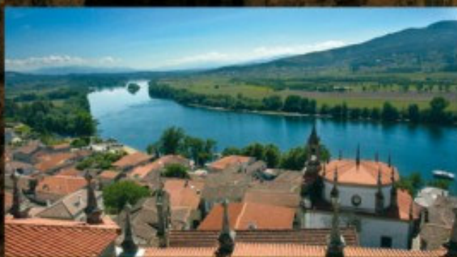
Río Miño visto desde la Catedral

Las magníficas condiciones naturales de este territorio posibilitaron el asentamiento humano desde tiempos remotos. El casco de bronce de Caldelas (en el Museo Diocesano) y el castro del Alto dos Cubos (en Pazos de Reis) son los principales testimonios de épocas prehistóricas.